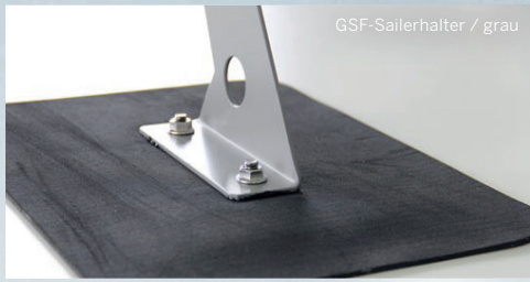
GSF-Sailerhalter / grau