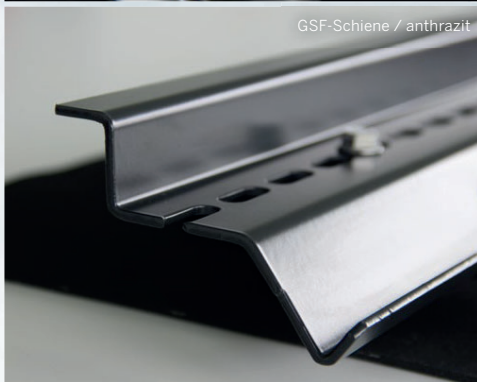
GSF-Schiene / anthrazit