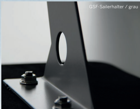
GSF-Sailerhalter / grau