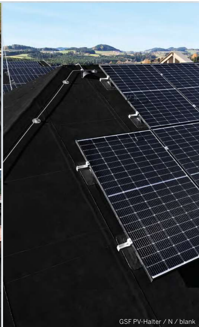
GSF PV-Halter / N / blank