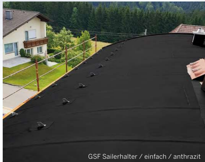
GSF Sailerhalter / einfach / anthrazit