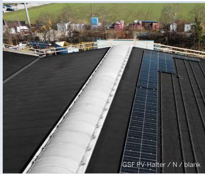
GSF PV-Halter / N / blank

Die Befestigung der GSF PV-Halter und GSF Sailerhalter erfolgt auf die fertige Abdichtung, in die tragende Unterkonstruktion. Halter und Manschette sind werksseitig dicht verbunden. Die Manschette wird mit der Dachabdichtung verschweißt.